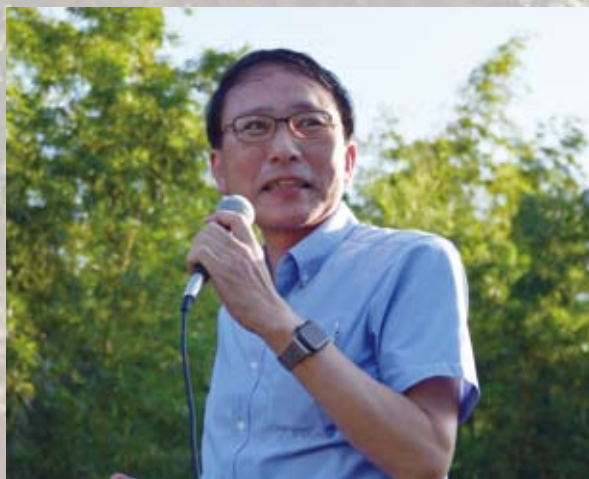
衆議院議員 葉梨 康弘殿