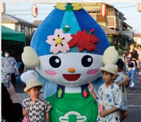
子どもたちととねりんの交流も久しぶり！

イベントの会場を早尾台緑地広場から自治会区民センターへ変更することで仮設の照明や仮設トイレ設置