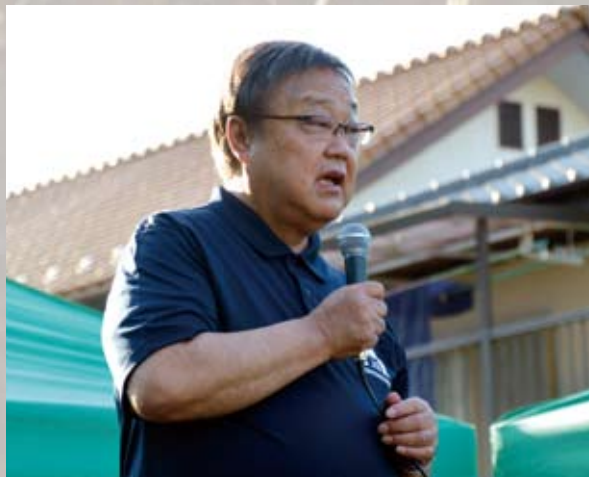
利根町 町長 佐々木 喜章殿

2020年2月頃から本格的な流行が始まった新型コロナウイルスを起因とする国民の行動制限は3年あまりの期間続きましたが、2023年5月8日以降、季節性インフルエンザと同様の5類感染症に移行したことにより、我々の生活は長い自粛生活から解放され、世界は4年前の生活を取り戻しつつあります。