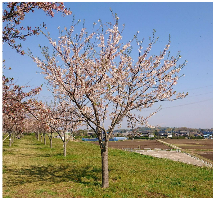
白鷺の街自治会の桜(4/4撮影)